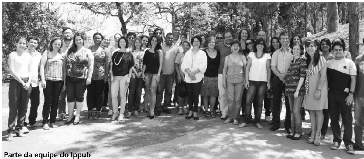
Parte da equipe do Ippub

Para utilizar o procedimento on-line, os profissionais com registro no Conselho Regional de Engenharia, Arquitetura e Agronomia devem se cadastrar no site www.ippub.betim.mg.gov.br/aprovacao para obter uma senha de acesso. Com o cadastro feito, as etapas iniciais para abertura do processo poderão ser realizadas diretamente