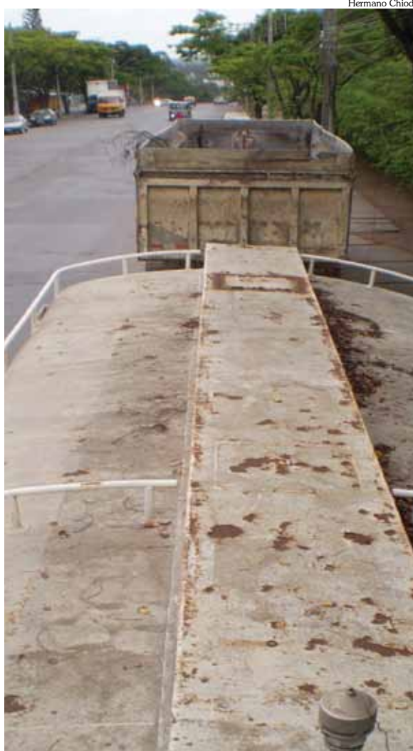
Carreta abandonada em via pública no Cinco, na região Eldorado, está avaliada em até 30 mil reais

Problemas mecânicos e desinteresse dos proprietários são as razões comuns para abandono de veículos que perdem valor e se deterioram ao ar livre. Somente a Prefeitura, mediante comunicado aos proprietários, pode fazer a retirada do veículo abandonado na rua.