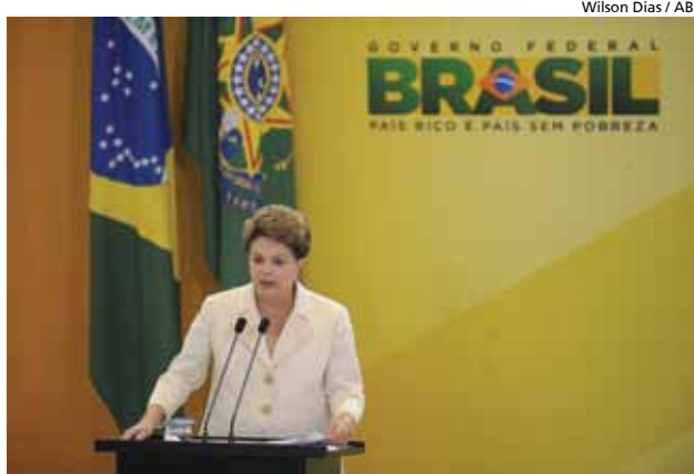
Presidenta Dilma Rousseff discursa durante lançamento do Programa "Melhor em Casa", em Brasília

O reforço e a estruturação gradativa das equipes de saúde do município para a implantação do Programa de Internação Domiciliar (PID) já permitiu quase dobrar a capacidade de atendimento mensal a esses pacientes em apenas três anos. Em 2009 a média era de 55 pacientes / mês, que no primeiro semestre de 2011 chegou a 86. Ao mesmo tempo, o aperfei-