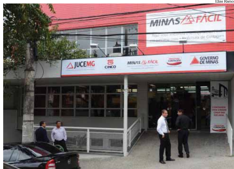
A unidade fica na Rua José Faria da Rocha, 2.909, no Bairro Eldorado