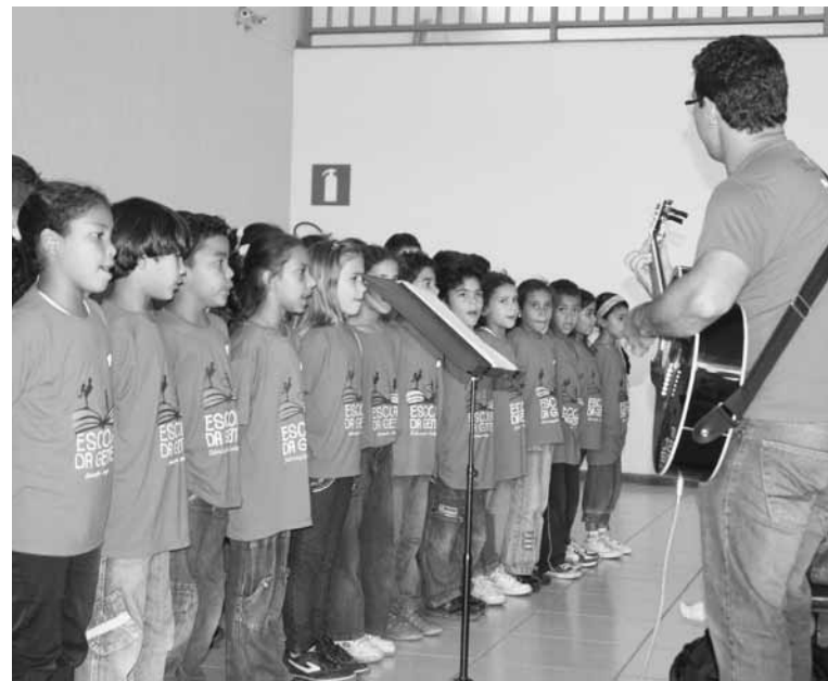
Alunos do Escola da Gente fazem apresentação cultural durante o Seminário que marcou comemorações de um ano do Ippub

demonstra a eficiência do trabalho desenvolvido pelo instituto e reconhece o propósito do Instituto em trazer mais facilidade para os que querem construir em Betim – um dos principais polos de concentração industrial e segunda maior arrecadação do estado, que tem atraído cada vez mais investimentos devido à sua localização estratégica. “O Ippub está em sintonia com o planejamento de modernização administrativa pensado para todo o estado”, acrescentou Lessa. Fonte: Prefeitura de Betim